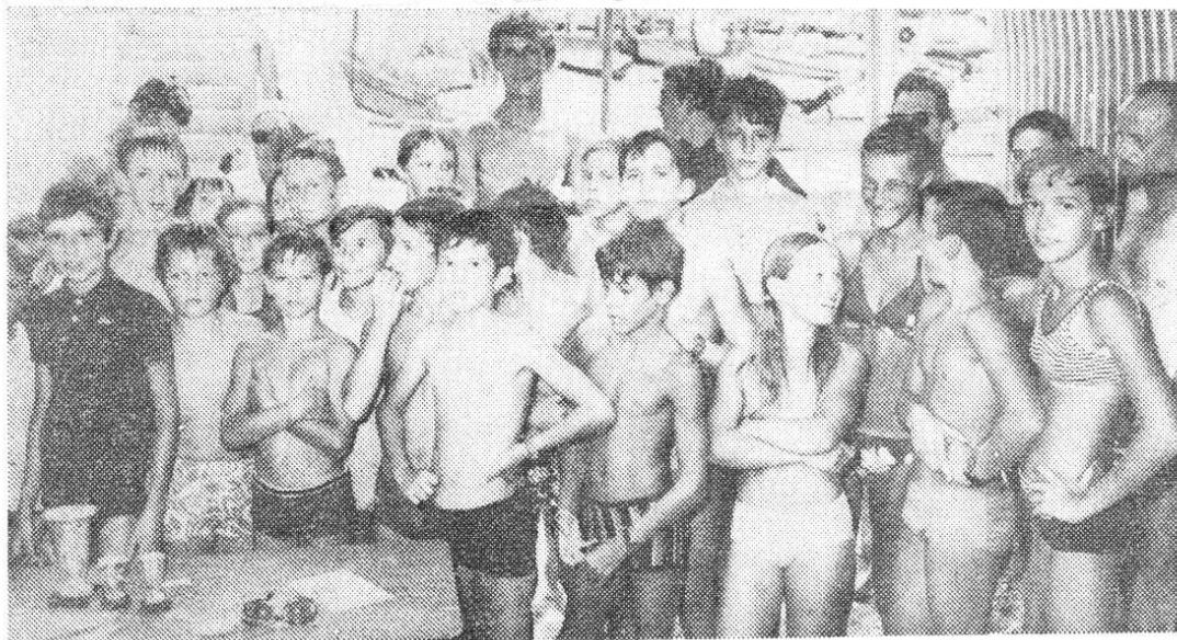
L'ambiance était excellente, au moment de la remise des récompenses. Tous ces jeunes barreaux attendent que les membres du jury aient fait leur classement.

Nous reviendrons demain sur la réception et la remise des prix.